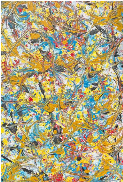
The Origin (detail acryl op doek 120x40cn) Erna Peereboom 2009